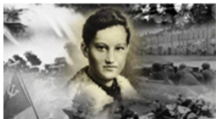
Космодемьянская Зоя Анатольевна (1923 – 1941)

Родилась в селе Осино - Гай Гавриловского района Тамбовской области. В 1930 г. семья Космодемьянских переехала в Москву. Перед Великой Отечественной войной Зоя училась в 201-й московской средней школе. Осенью 1941 г. она была десятиклассницей.