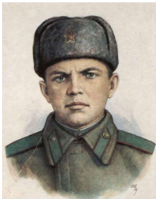
Александр Матросов 5.02.1924-27.02.1943 Герой Советского Союза

Родился 5 февраля 1924 года в городе Екатеринославе (далее переименованном в Днепропетровск, а ныне в Днепр). По другой версии, настоящее имя Матросова — Шакирьян Юнусович Мухамедьянов, а место рождения — деревня Кунакбаево Тамьян-Катайского кантона Башкирской АССР (ныне Учалинского района Башкортостана). При этом сам Матросов называл себя именно Матросовым.