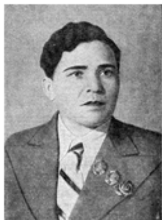
Полина Денисовна Осипенко