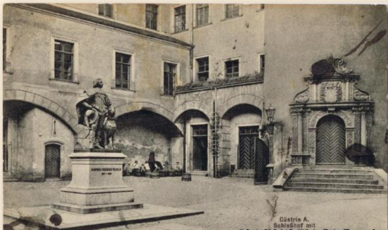
Güstrin A. Schloßhof mit